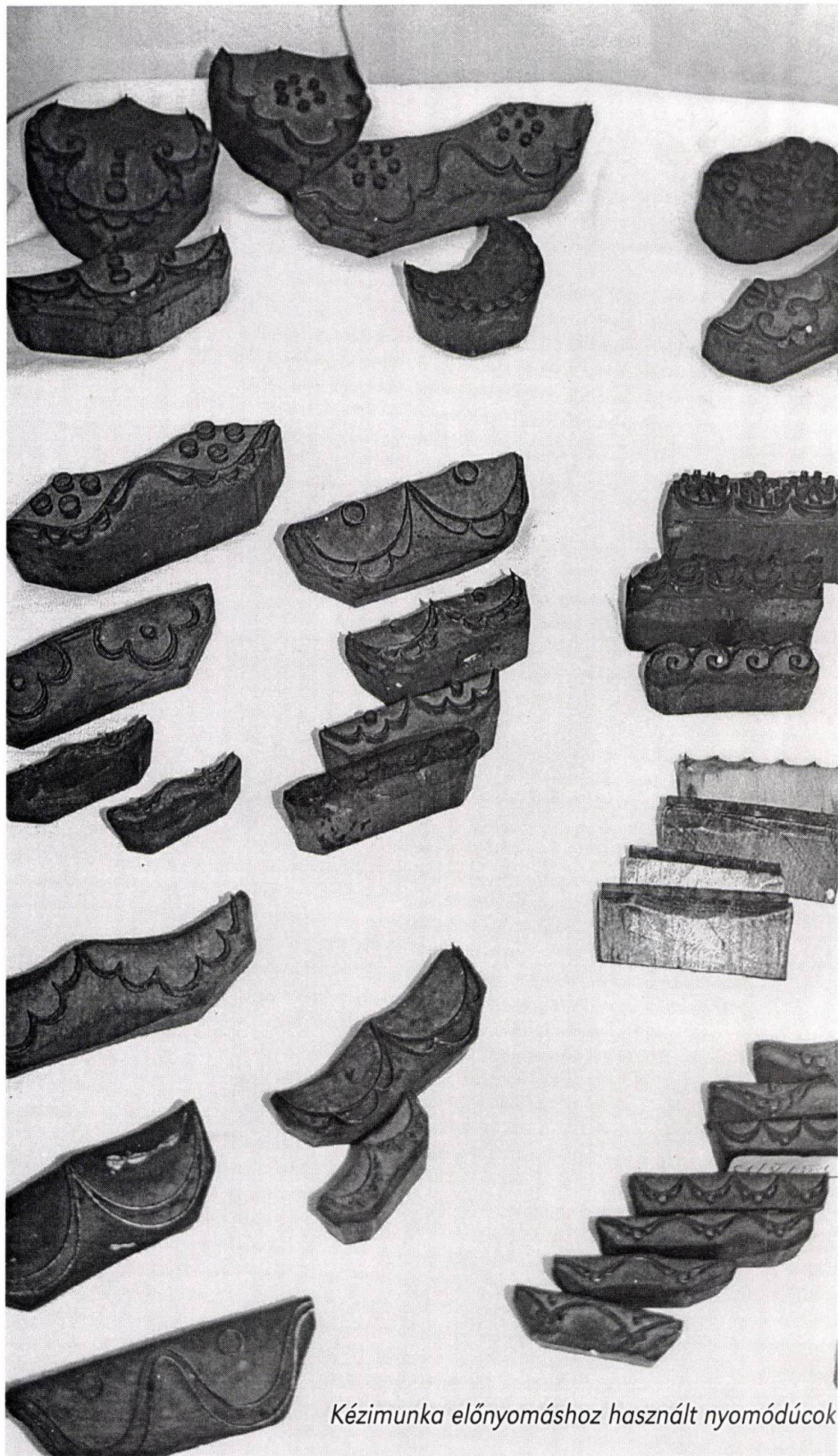
Kézimunka előnyomáshoz használt nyomódúcok