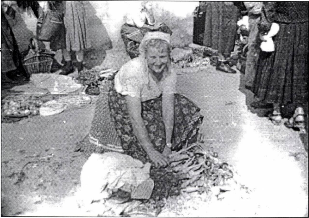
Piaci árusok a paksi piacon előnyomott mintájú blúzban 1959-ben